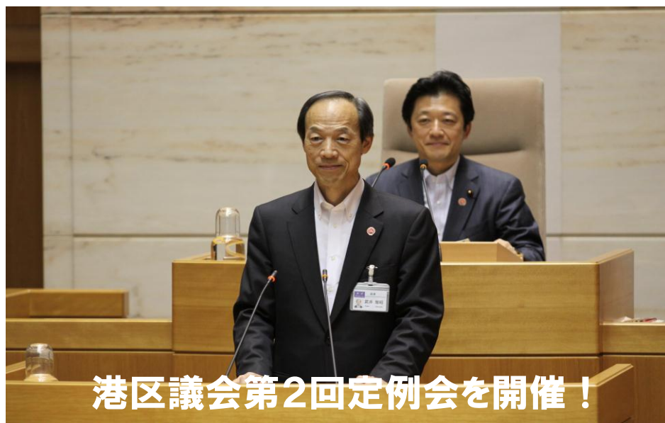
港区議会第2回定例会を開催！