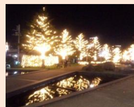
東京ミッドタウン

赤坂・青山地域ではイルミネーションが多く見受けられます。一年の締めくくりを無事故で過ごされ、素晴らしい一年の出発をされたことをお喜び申し上げます。本年も楽しい思い出をたくさんつづって頂くことを祈念しております。